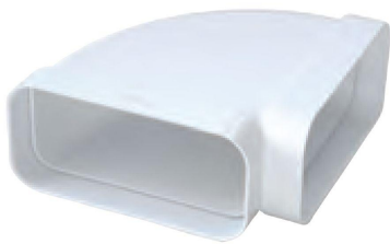
CCO126B CCO157B CCO229B

Curva orizzontale a 15° MF per tubo rettangolare. Possibilità di comporre curve a 30° (con 2 pz) o 45° (con 3 pz).