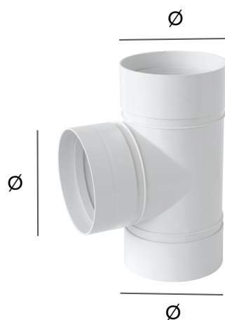
Raccordo a T con imbocchi FFF