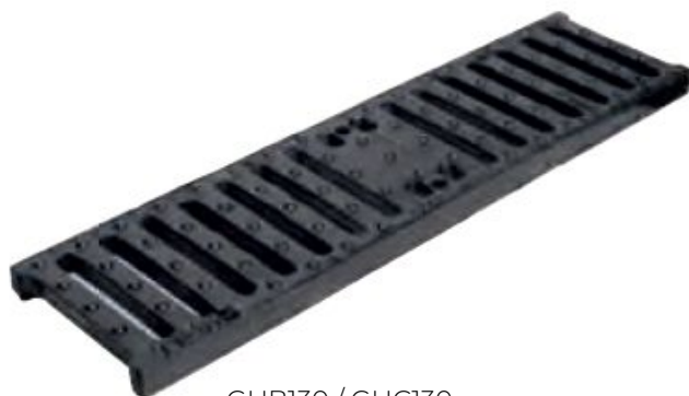
GHB130 / GHC130