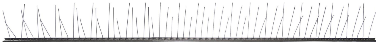
SPINOX base rigida