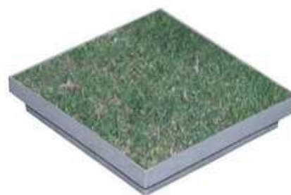
Esempio di applicazioni